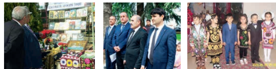
Неделя детской и юношеской книги в Таджикистане, апрель 2019 года