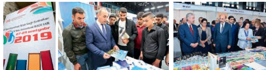
Бакинская книжная ярмарка, 4 – 8 февраля 2019 года