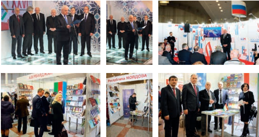
Минская международная книжная выставка-ярмарка, 6–10 февраля 2019 года