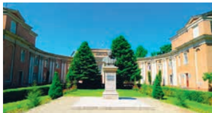
Конференция «Внедрение инновационных процессов в научных библиотеках», апрель 2019 года