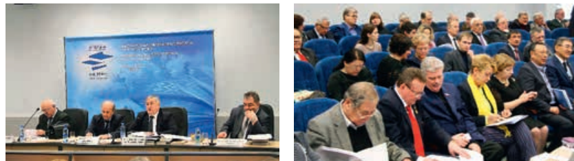
Международный симпозиум литераторов «Писатель и время», 5–9 февраля 2019 года