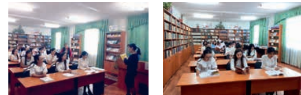
Единый урок, посвященный Году книги в СНГ, Торгайский гуманитарный колледж имени Н. Кулжаковой, 31 мая 2019 года