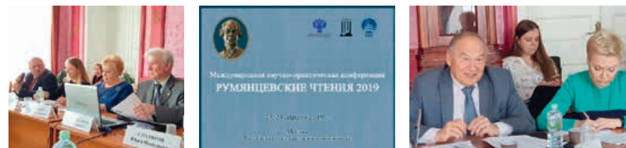
Круглый стол «Сотрудничество библиотек стран СНГ: стратегические направления» в рамках научно-практической конференции «Румянцевские чтения — 2019», 23–24 апреля 2019 года