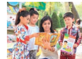
Республиканский «Праздник книги» на Ташкентской международной книжной выставке-ярмарке, 2-4 апреля 2019 года