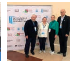
Читательская Ассамблея Содружества, 18 сентября 2019 года