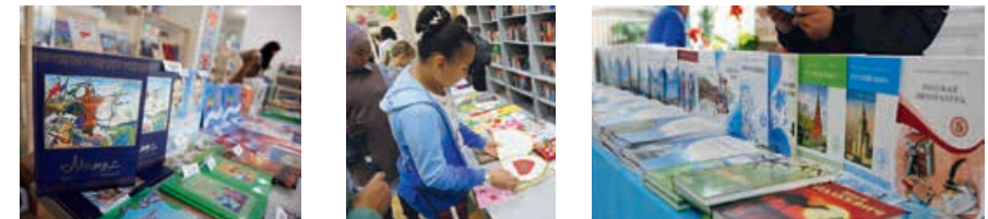
Всемирный день книги и авторского права, 23 апреля 2019 года