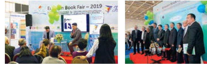
IV Евразийская книжная выставка-ярмарка «Eurasian book fair — 2019», 24–27 апреля 2019 года