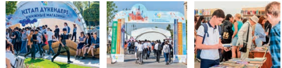
Книжная выставка-ярмарка «Китепстап» 23 апреля 2019 года