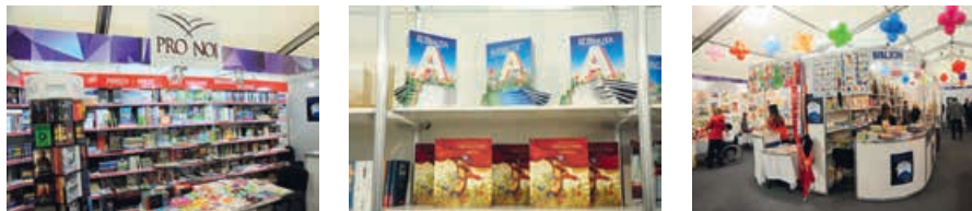
XXIII Международная книжная ярмарка (Салон) для детей и юношества, 11–14 апреля 2019 года