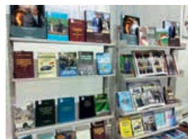
IX Душанбинская международная книжная выставка, 4 сентября 2019 года