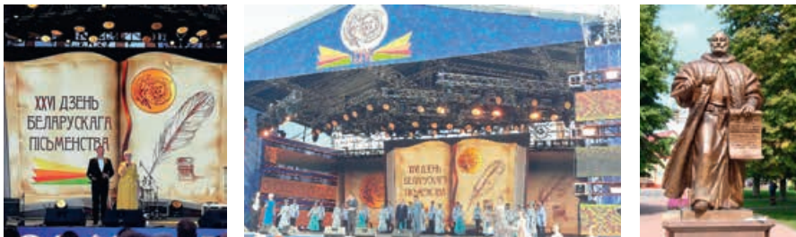
День белорусской письменности в Слониме, 1 сентября 2019 года