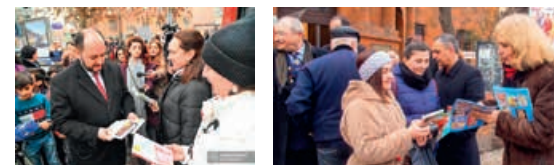
День дарения книги, 19 февраля 2019 года