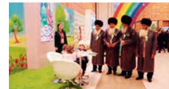
XIII Международная книжная выставка-ярмарка и научной конференции на тему «Книга – путь сотрудничества и прогресса», 5–6 ноября 2019 года