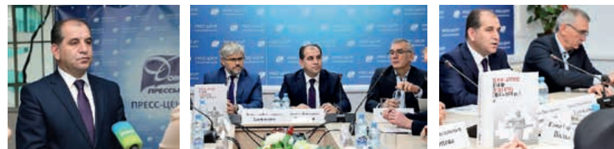
Презентация книги Воины-Армяне в боях за Беларусь 1941–1944 год , 4 февраля 2020 года