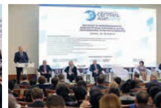
Международная конференция на тему «Central Asia: информационно-библиотечные ресурсы в науке, образовании, культуре и бизнесе» в Ургенче, 24–25 апреля 2019 года