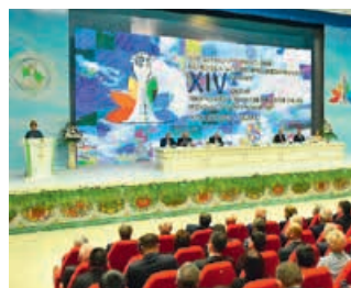
XIV Форум творческой и научной интеллигенции государств — участников СНГ, 15–16 мая 2019 года