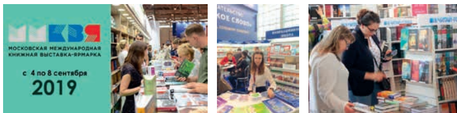
Московская международная книжная выставка, 4–8 сентября 2019 года