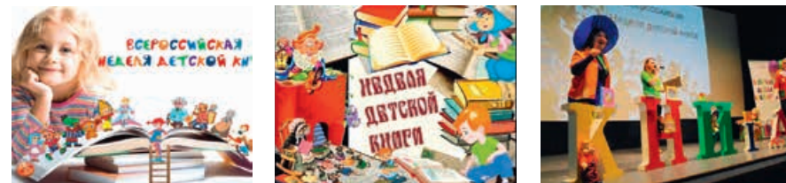
Акция «Книжная неделя», организованная совместно с российскими региональными библиотеками, 25–31 марта 2019 года